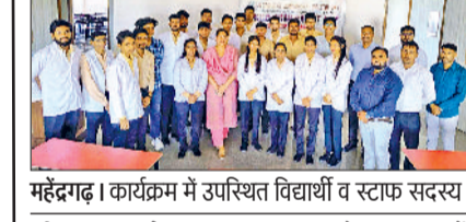
कनीना। कार्यक्रम में भाग लेती छात्राएं। फोटो: हरिभूमि

महेन्द्रगढ़। आध्यात्मिक प्रवचन देती छात्रा। फोटो: हरिभूमि