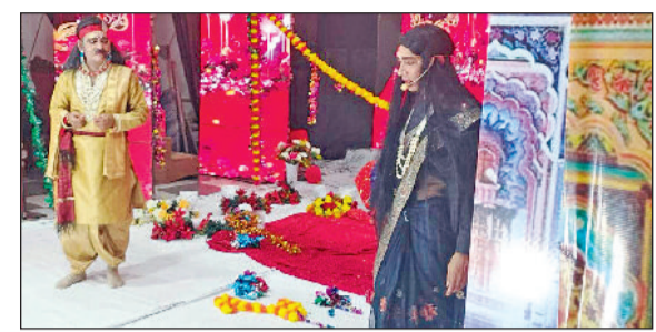
नारनौल। रामलीला में मंचन करते कलाकार।