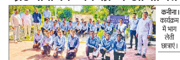
कनीना। कार्यक्रम में भाग लेती छात्राएं। फोटो: हरिभूमि

महेन्द्रगढ़। आध्यात्मिक प्रवचन देती छात्रा। फोटो: हरिभूमि