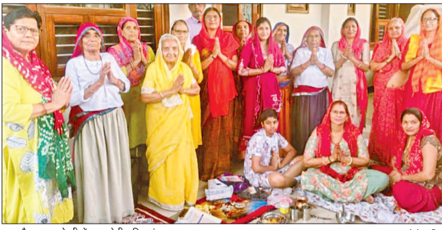
नारनौल। यज्ञ गोष्ठी में भाग लेती महिलाएं।