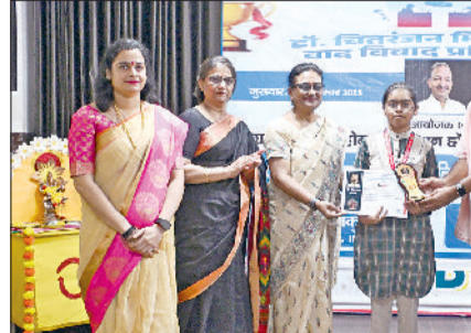
नारनौल। विजेता छात्रा को सम्मानित करते हुए।