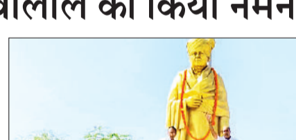
महेन्द्रगढ़। कार्यक्रम में उपस्थित विद्यार्थी व स्टाफ सदस्य।